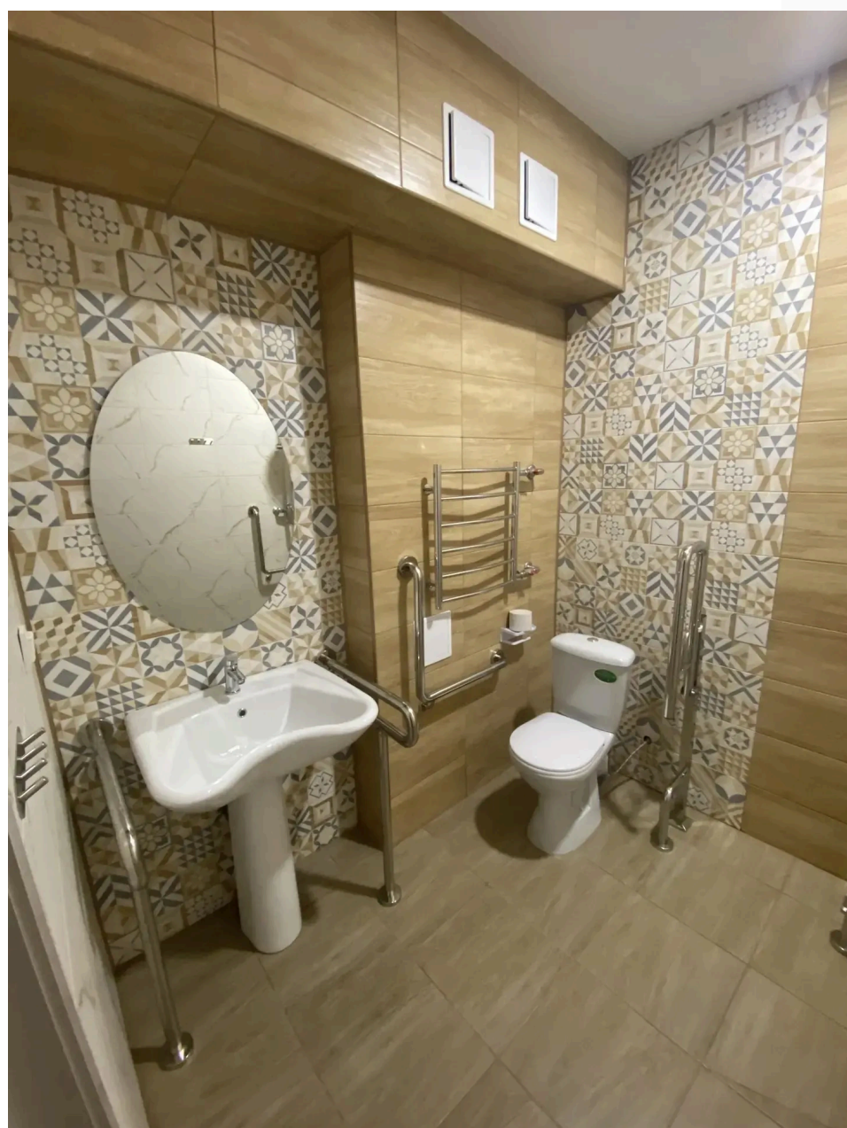
душевые 2 и 5 корпус