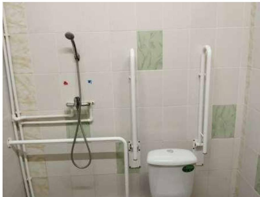
Адаптированный поручнями санузел